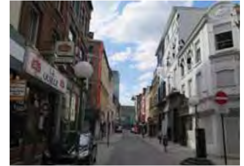
Et aujourd'hui : à droite, le Vecteur

La rénovation (2004 - 2008) a été conduite par l'architecte Jean-Michel Autenne. Les espaces intérieurs ont été repensés en fonction de la nouvelle affectation : accueil, exposition, projection... Les façades se signalent par une fresque géante inspirée des techniques de camouflage pour bateaux de guerre, détournées ici symboliquement pour créer un point de repère urbain (dans le cadre de Couleur carolo en 2011, projet Réservoir A, Harrisson, G. Leroy, F. Plateus).