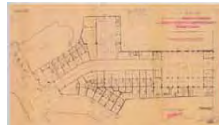
Plan du Passage de la Bourse et de la Bourse de commerce

Libérée plus tôt de ses murailles fortifiées, et dans la foulée du développement industriel du Bassin de Charleroi, la Ville Basse devient dès le milieu du 19 e siècle une vitrine de la finance et du commerce.