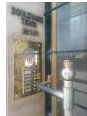
Détail d'une porte d'entrée privative

Assurant la jonction avec l'ancien quartier bourgeois de la rue de Montigny, cette galerie commerçante « chic » est une initiative privée : elle doit son nom à l'homme d'affaires et promoteur Gustave Bernard, comme l'indique une plaque commémorative (côté boulevard). Après son décès en 1950, les travaux sont achevés par sa veuve au sein de la SA Immobilière du Nouveau Boulevard. La galerie piétonne, qui relie des blocs d'immeubles à front des deux voiries, est grevée d'une servitude publique établie par une convention avec la Ville.