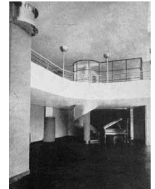
Vue ancienne de la salle de vente du rez-de-chaussée