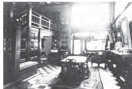
L'ancienne salle à manger de l'Hôtel Van Bastelaer

Cette demeure bourgeoise est l'oeuvre de l'architecte carolorégien Marcel Leborgne, l'un des ténors belges du modernisme. Sa façade est moderne mais utilise le langage habituel des « hôtels de maître » : baies en plein cintre, bow-window, pierres taillées et ferronneries ouvragées, ou encore lucarne en forme d'œil-de-boeuf... Autant de signes distinctifs traditionnels des maisons bourgeoises. Le commanditaire fait partie des « gens de robe » dont bon nombre s'établissent dans ce quartier à proximité de l'ancien Palais de Justice (à l'époque, au boulevard Audent) né après la démolition des contreforts fortifiés de la Ville Haute.