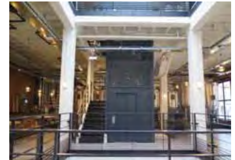
... Après, la brasserie de LaM.U