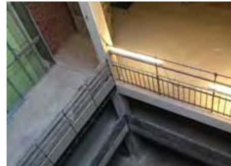
Avant travaux

Elle s'est installée dans un bâtiment bien connu des Carolos, chargé de souvenirs puisqu'il accueillait la médiathèque de Charleroi jusqu'en 2004.