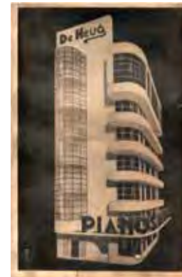
Dessin de Marcel Leborgne

Commandité en 1933 par la firme de pianos DE HEUG, l'immeuble héberge un duplex commercial au rez-de-chaussée et un auditorium au dernier étage tandis que les quatre niveaux intermédiaires sont occupés par des appartements. Classé en 1995 (façades, toitures et cage d'escalier), il a fait l'objet d'une profonde restauration sur fonds privés qui touche à sa fin. Elle a nécessité le renouvellement d'une grande partie des matériaux conformément à l'état d'origine : revêtement en Travertin des façades, la plupart des bétons (Bureau Studeo-Nicolas Créplet). Les châssis métalliques ont été sauvegardés et munis de doubles vitrages. Le rez-de-chaussée a retrouvé sa configuration en mezzanine de l'époque.