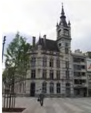
L'Hôtel des postes dans son environnement actuel