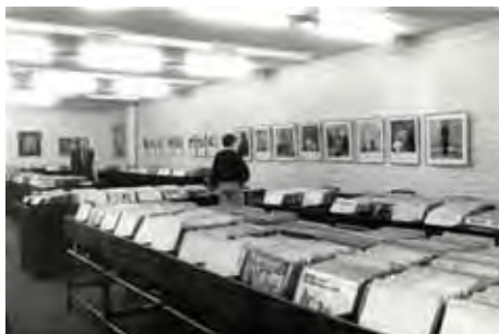
Et encore avant... : la célèbre médiathèque de Charleroi

Depuis le départ des rayonnages de vinyles qui ont fait vibrer tant d'oreilles, il tombait en ruine. Le potentiel des espaces de ce lieu, qui fut originellement une fabrique de papiers peints, puis un magasin de meubles, est remarquablement mis en valeur par la restauration. Aménagés sur trois étages, ceux-ci s'ouvrent sur un somptueux puits de lumière donnant un cachet particulier à ce nouveau haut lieu de l'art de vivre carolorégien. À côté de l'atelier situé rue de Brabant, s'ajoute un restaurant « La Table », ouvert récemment sur la place Buisset.