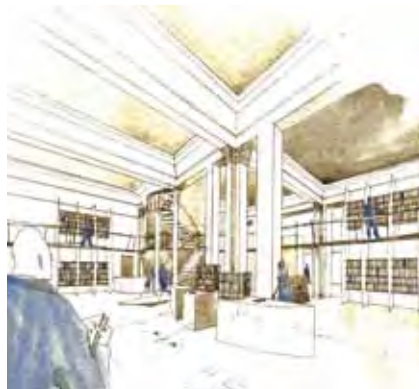
Projet d'aménagement intérieur de la librairie Molière, 1995