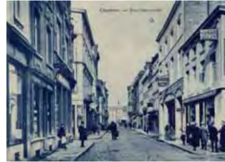
La rue de Marcinelle au début du 20 e siècle

C'est à front d'une des plus anciennes rues de la Ville Basse, menant à l'origine à une porte de la ville fortifiée, qu'est situé « Le Vecteur ». Cet espace de création et diffusion artistique fut créé en 2008 à l'initiative de l'ASBL Orbitale : cette plate-forme associative, pluridisciplinaire et ouverte à l'expérimentation, a pris ses quartiers dans deux immeubles occupés autrefois par des commerces. Dans l'un d'eux, le théâtre du Vaudeville avait ouvert ses portes dans les années 1970.