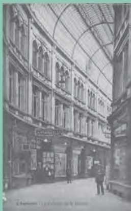
Carte postale – © E. Grandchamps

La mode des rues commerçantes couvertes connaît alors son apogée, portée par les progrès technologiques des constructions en fer et verre. Construit par l'architecte Edmond Legraive à l'emplacement de l'ancien Couvent des Capucins, il rejoint la rue du Collège en dessinant une légère courbe dictée par la présence de l'église Saint-Antoine de Padoue.