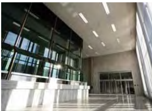
Les guichets de l'ancienne Banque Nationale