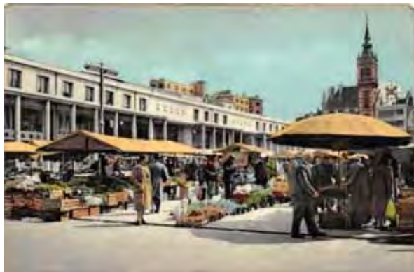
La place Albert 1 er du temps des « Colonnades »