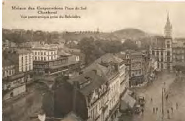
Le « vieux Charleroi » au début du 20 e siècle : la Sambre, les maisons qui bordent la place et l'Hôtel des postes

Bâti par l'architecte De La Croix, il évoque le style néo-Renaissance flamande marqué par l'usage de pignon à gradins, de croisées de fenêtres en pierre, d'une tour dotée de tourelles d'angle et terminée par une flèche à bulbe. Fonctionnelle, cette tour servait aux transmissions télégraphiques. Délaissé par la Poste, occupé ensuite par les Finances, ce monument prestigieux se retrouve désaffecté. Préservé grâce à son classement en 1992, il est racheté par la librairie Molière et rénové en 1995, devenant, grâce à cette initiative privée, un nouveau pôle culturel de la Ville Basse : un exemple réussi de reconversion dynamique du patrimoine ! Les façades et toitures ont été restaurées avec le soutien financier de la Wallonie en respectant le style originel tandis que l'espace intérieur du rez-de-chaussée est mis en valeur dans une scénographie contemporaine.