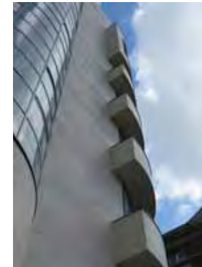
Une architecture virtuose qui évoque les touches d'un piano...